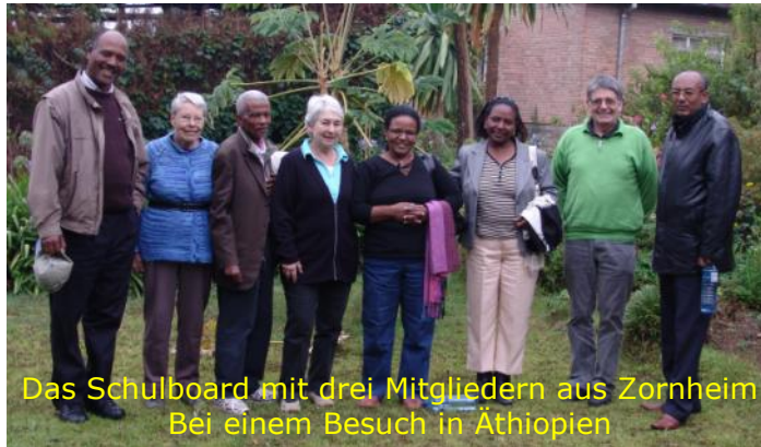
Das Schulboard mit drei Mitgliedern aus Zornheim Bei einem Besuch in Äthiopien

Der Kirchenvorstand beschloss daraufhin, die vorhandene Vorschule (Kindergarten) und den Neubau und die Unterhaltung einer Grundschule durch Spenden zu unterstützen.