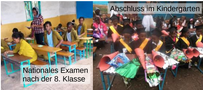
Abschluss im Kindergarten

Wir wollen den Kindern in Äthiopien durch qualifizierte Schulbildung eine bessere Chance für ihre Zukunft ermöglichen